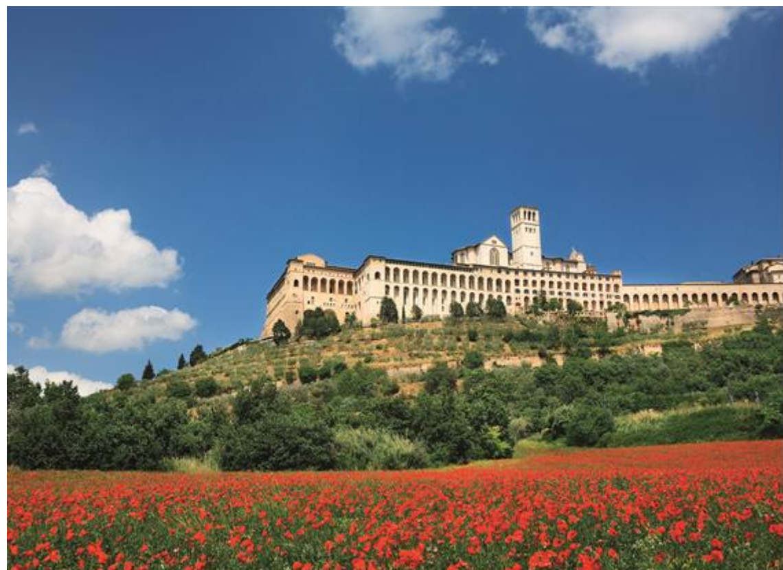
Sacro Convento San Francesco, Assisi

Die beigefügten Allgemeinen Reisebedingungen sind Bestandteil dieses Prospektes. Regelungen zum Rücktritt vor Reiseantritt: siehe Ziffern 6 & 7 (Stornobedingungen Ziffer 7.1)